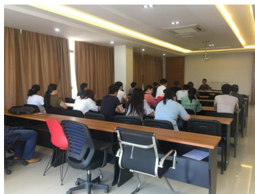
公司培训现场照片