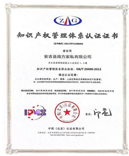
知识产权管理体系证书