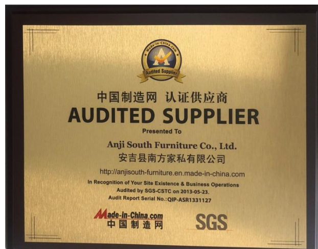
中国制造网认证供应商证书