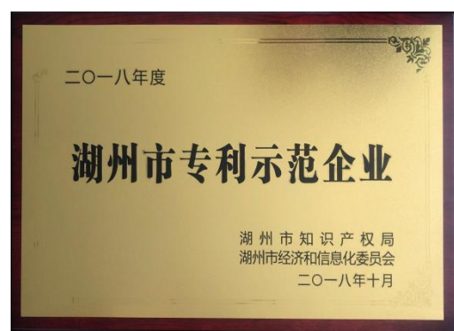
湖州市专利示范企业