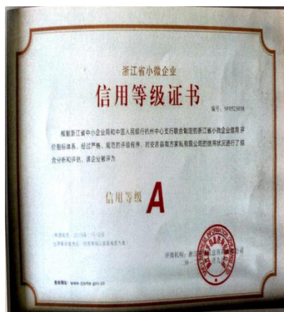
信用等级 A 级证书