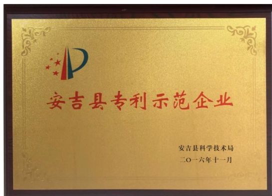
安吉县专利示范企业