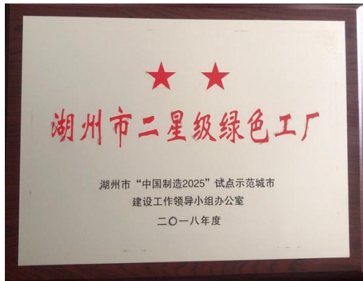
湖州市二星级绿色工厂证书

公司树立“产品质量安全高于一切”理念，建立了“内外兼修”的质量管理体系，对每道工序实行流程化管理。公司建立了从原料到成品的全生命生产周期的管理系统，确保产品的可追溯。同时，公司定期召开质量专题会议、质量专题培训，强调树立品质意识；一要管理人员带头，二要重视客户意见，三要实现全体员工的追求零缺陷目标，防患于未然，四要更好地发挥各级质量人员的作用。公司每年开展安全生产月活动，且与各生产单位负责人签订责任书以加强各级管理人员的安全责任。南方家私实行质量安全“一票否决”制。公司质量管理体系从持续改进，向追求卓越看齐，建立了以公司战略为核心，以 GB/T 19580 卓越绩效管理模式为框架的整合型全面质量管理体系。满足客户、股东、员工、供应商、社会和合作伙伴六大利益相关方的要求，在公司各层面建立了相应的战略规划、质量目标。以公司绩效考核体系为依托，设立了质量考核 KPI 和质量问责制。