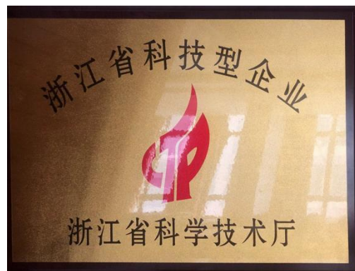
浙江省科技型企业证书